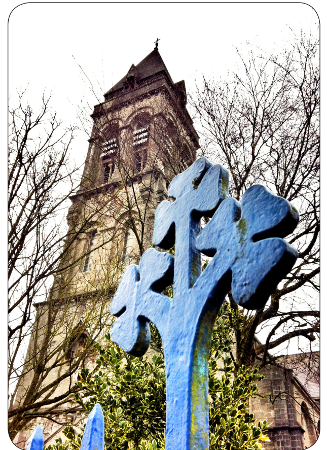
Bild zusammen ab. Sligo bedeutet übersetzt übrigens „Platz der Muscheln“, da die Stadt berühmt ist für die schmackhaften Muscheln am Hafen.